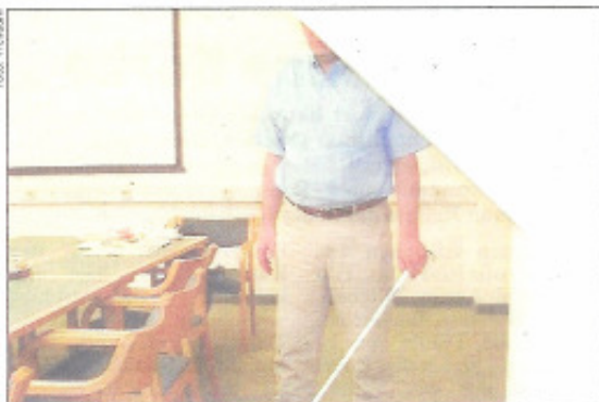
Für blinde Menschen ist dieser Vorbau gefährlich.

helfen Sie schon jetzt! Ein Sprichwort sagt: „Im Leben kommt einem immer alles zurück.“ Die Erfahrung vom Verein Freiraum: Manchmal kann Ihnen nichts Besseres passieren. Spendenkonto: Hypobank OÖ BLZ: 54000 KontoNummer: 88880